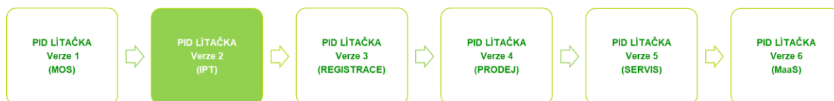
Obr. 1: Obecné schéma součástí naplňování vize MaaS (blíže viz kapitola 9 této specifikace)

Hlavní funkcí řešení je vyhledávání spojení v celém spektru veřejné dopravy pokrývající Pražskou integrovanou dopravu (dále též PID) a rozšíření této služby o kombinaci s dalšími druhy dopravy, další území a parkování, a to za celou trasu a pro všechny druhy dopravy uvedené v této specifikaci. Bude tak poskytován kvalitativně i kvantitativně generačně vyšší standard vyhledávací funkcionality v mobilní aplikaci a na webu PID Lítačka a výhledově i v dalších aplikacích Objednatele v souladu se současnými trendy a konceptem Mobility as a Service (MaaS).